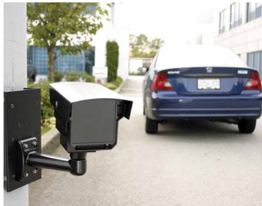
Kentekenherkenning en registratie van onregelmatigheden is de camera's op Schuttersveld zeker toevertrouwd.